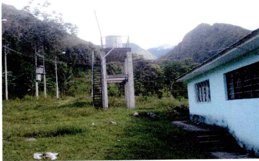
Plataforma de tanques elevados

Plataforma de tanques elevados. - Falta limpieza y mantenimiento base de tanques.