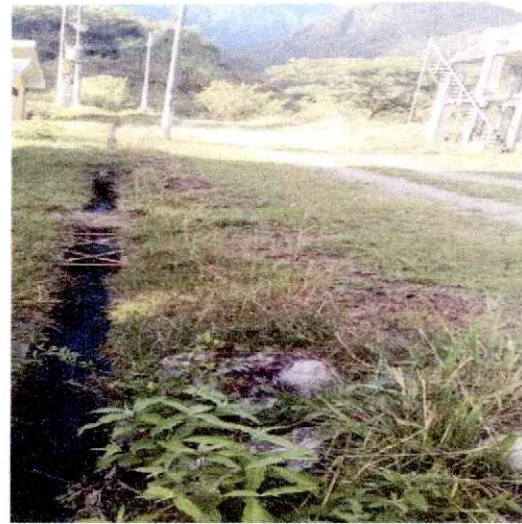
Caja cubierta por vegetación