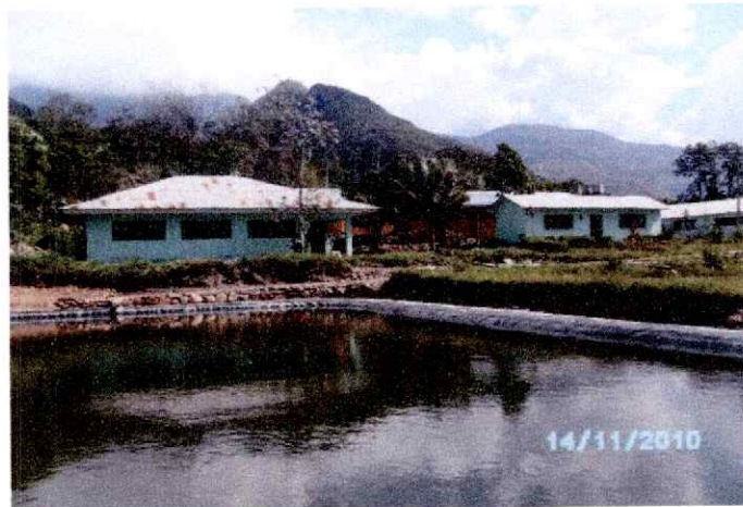
Vista de vivienda de personal y Oficina de jefatura

" Año de la Unidad, la paz y el desarrollo "