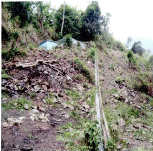
Caja distribución de agua