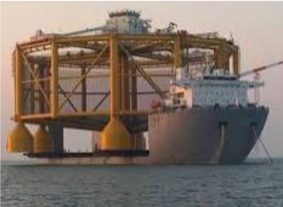
Piscicultura Off Shore