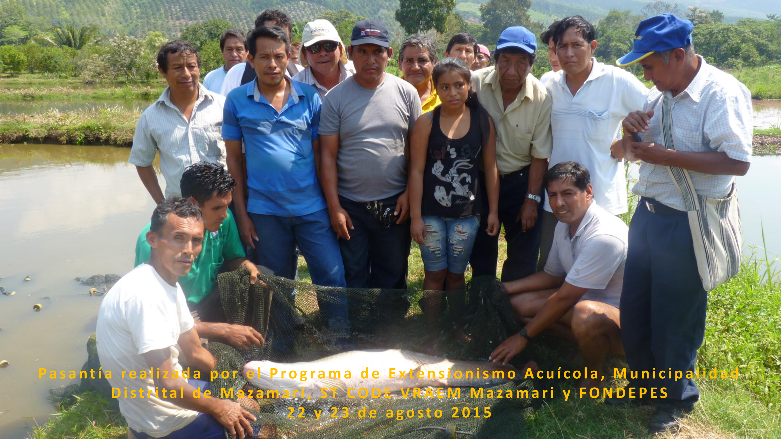
Pasantía realizada por el Programa de Extensionismo Acuícola, Municipalidad Distrital de Mazamari, ST CODE VRAEM Mazamari y FONDEPES 22 y 23 de agosto 2015