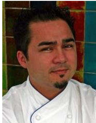
Michael Blois Sushi Samba Miami