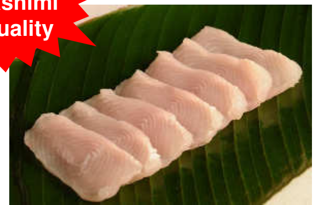
Sashimi de Paiche