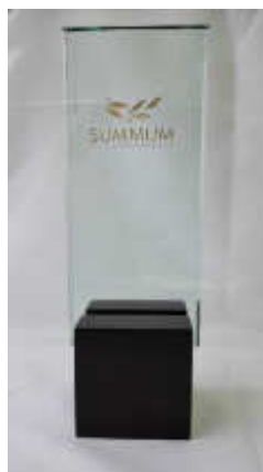
Premio Summum 2015