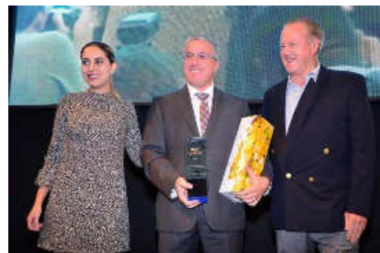
Premio Ivan Kistic a la sostenibilidad 2015