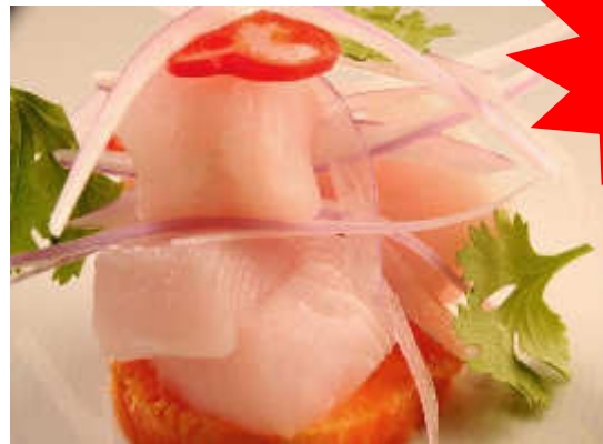
Cebiche de Paiche