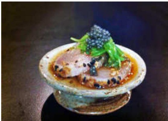
Tataki de Paiche sellado con semillas de sésamo