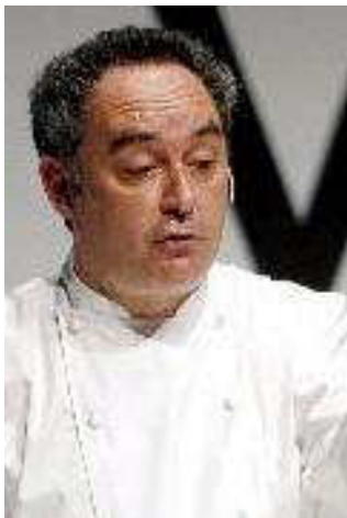
Ferrán Adriá El Bulli Madrid