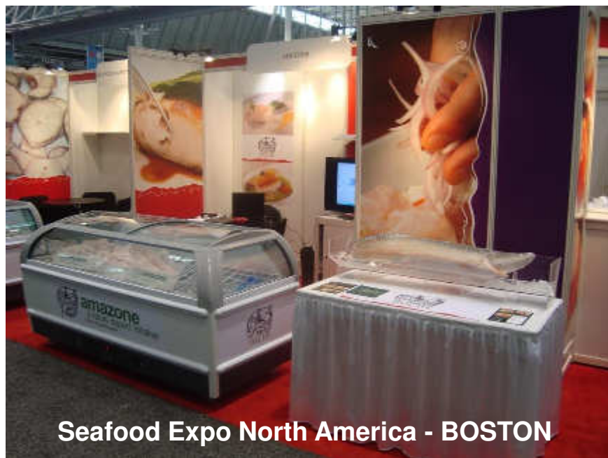
Seafood Expo North America - BOSTON