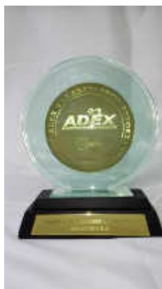
Premio innovación exportadora Adex - 2014