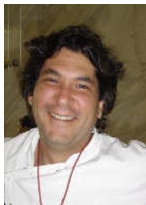
Gastón Acurio Astrid y Gastón