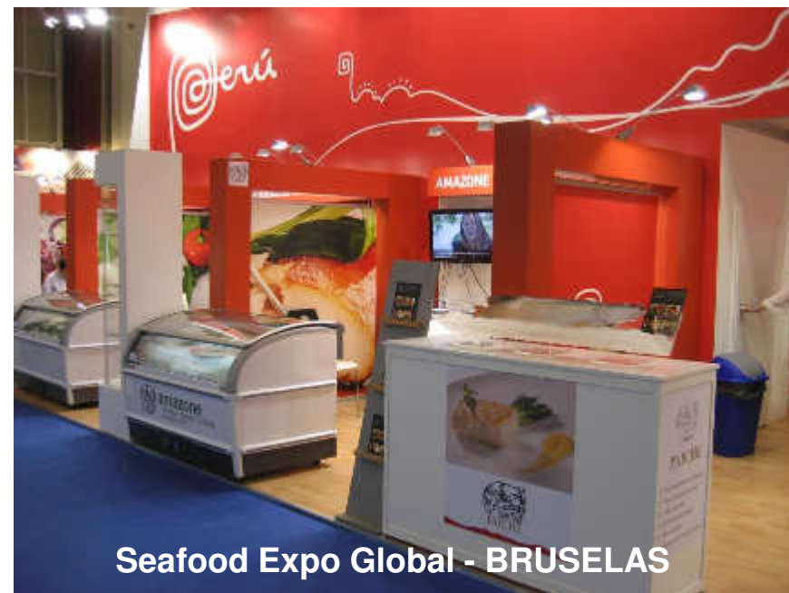
Seafood Expo Global - BRUSELAS