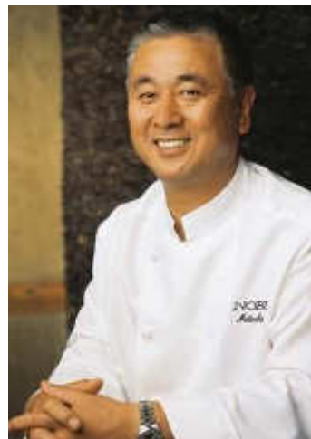
Nobu Matsuhisa Nobu Tokio