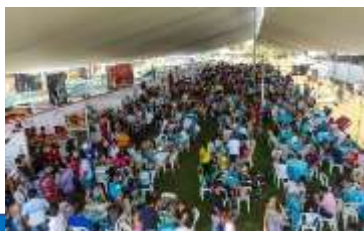
FESTIVAL GASTRONÓMICO Demo cocina