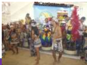
Presentaciones culturales y estelares