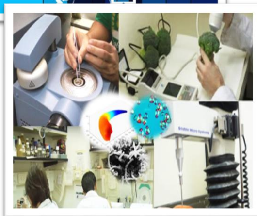
Desarrollo y adaptación de tecnología