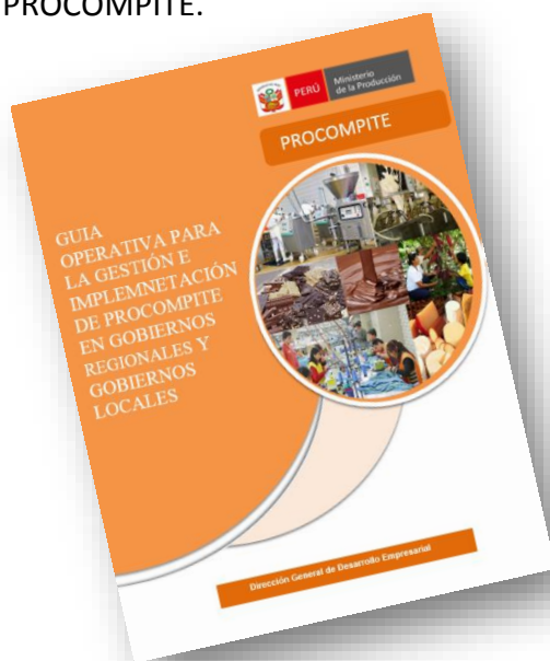
Guía Operativa de PROCOMPITE

Se recomienda revisar la Guía Operativa para la Gestión e Implementación del PROCOMPITE en los Gobiernos Regionales y Gobiernos Locales, documento en donde encontrara los procesos para la implementación de PROCOMPITE.