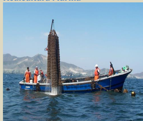
Cultivo suspendido de Conchas de Abanico