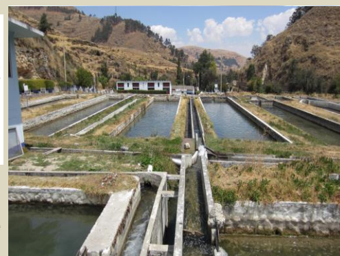
Posas de cultivo de Trucha en Ingenio -Huancayo

A través de la RNIA también accedes al Catastro Acuicola Nacional