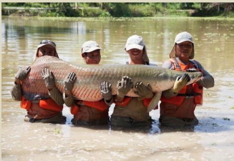
Cultivo de Paiche