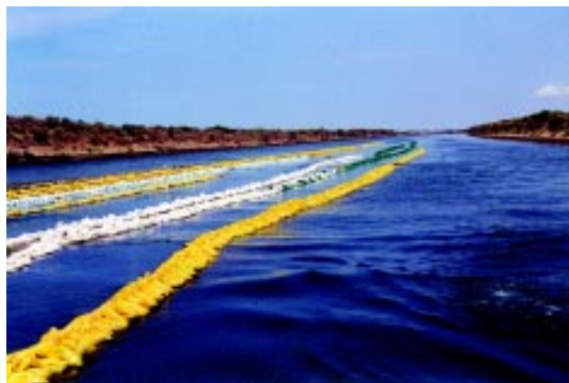
Figura 2 Las áreas de cultivo deberán estar libres de peligros biológicos y peligros químicos.

minimicen la posibilidad de riesgos de contaminación en estos productos.