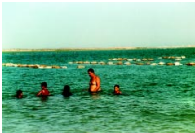
Figura 3 Las descargas de aguas negras de ríos y/o el bañarse en áreas de cultivo son fuente de contaminación de bacterias entéricas.

La Tabla IV.1 y IV.3 (Anexo IV) resume información importante de algunos de los peligros mencionados.