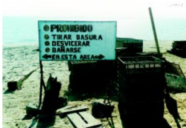
Figura 6 No se permitirá bañarse en áreas de cultivo, porque representa un peligro de contaminación biológica.

El primer paso para la disminución de riesgos en granjas ya establecidas, es la adopción de buenas prácticas de cultivo que establezcan las bases de higiene y sanidad necesarias para la producción de moluscos bivalvos, inocuos para el consumo humano (Figura 6). Al mismo tiempo es necesario un programa de capacitación para el personal de la granja, considerando los diferentes niveles de la estructura de la empresa, con el fin de que todos laboren bajo la misma política.