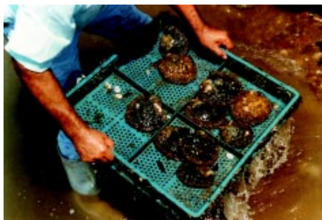
Figura 13 El equipo de captura y recolección debe ser adecuado para mantener la inocuidad de los moluscos.

■ Las áreas de cosecha y todo el equipo que se use debe ser lavado y descontaminado. Los materiales deben estar libre de corrosión, y no transmitir sustancias tóxicas (Figura 13).