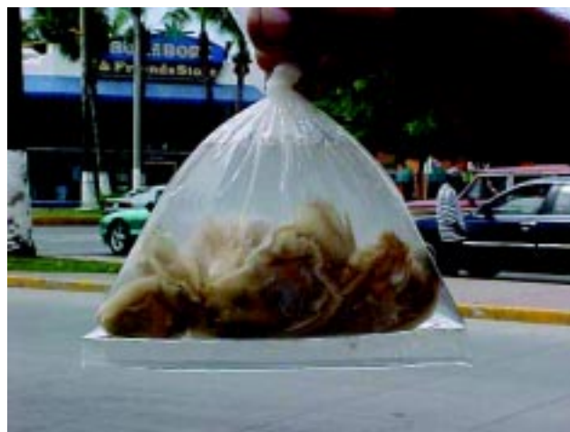
Figura 1 Venta de ostiones de dudosa procedencia en la vía pública.