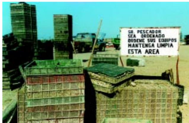
Figura 8 Mantener las instalaciones ordenadas e higiénicas, evita la presencia de plagas.

■ Si es necesario la aplicación de cualquier sustancia para el control o eliminación de plagas en cualquier parte del proceso, ésta debe realizarse por personal capacitado y cumplir con las especificaciones establecidas en el catálogo oficial de plaguicidas vigente del CICOPALFEST.