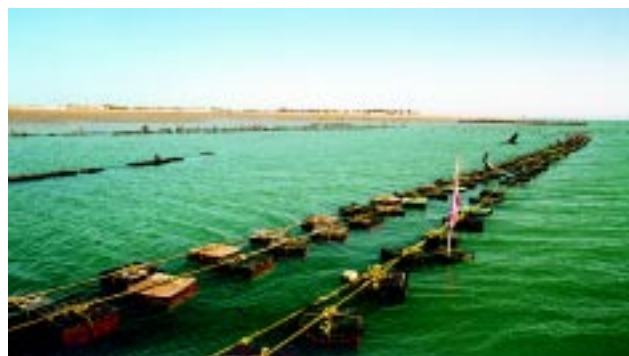
Figura 10 La autoridad dictaminará la localización de los puntos de muestreo para determinar la calidad del agua del área de cultivo.

a) «En áreas de cultivo donde existan fuentes de contaminación que tengan un impacto sobre la calidad del agua, se tomarán un mínimo de 30 muestras en cada punto de monitoreo en varias condiciones ambientales y será necesario clasificar cualquier área no clasificada anteriormente. Excepto para áreas de cultivo reconocidas como prohibidas».