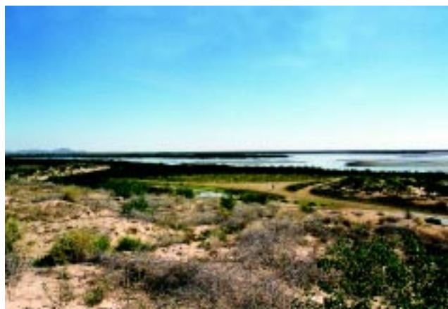
Figura 5 Las áreas a ser seleccionadas como sitios de cultivo deberán estar alejados de asentamientos humanos, industrias, ríos, etc.

■ Al momento de elegir el sitio, es importante considerar la posibilidad de tener un lugar de depuración con las debidas características como medida de mitigación en caso de una contaminación.