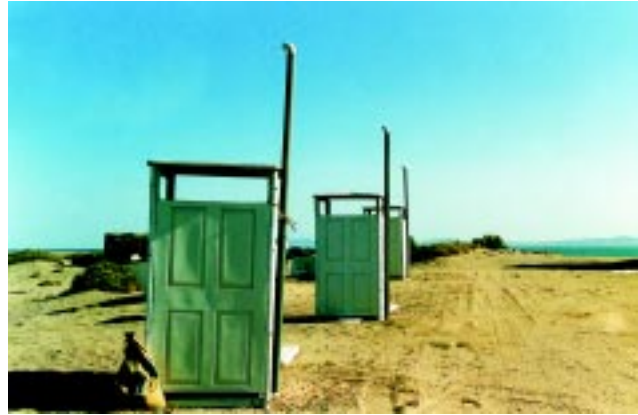
Figura 7 Las instalaciones deberán contar con letrinas para la higiene del personal y estas deberán estar alejadas de las áreas de cultivo y cosecha de los moluscos.

■ La granja debe contar con el equipo y materiales necesarios para la limpieza. Todo el equipo y utensilios en la granja deben mantenerse limpios y en caso necesario, también deben desinfectarse. Es importante que el equipo y material de limpieza que esté asignado a una sección específica de la granja, sea utilizado exclusivamente para esa área y no en otra, para prevenir la contaminación cruzada.