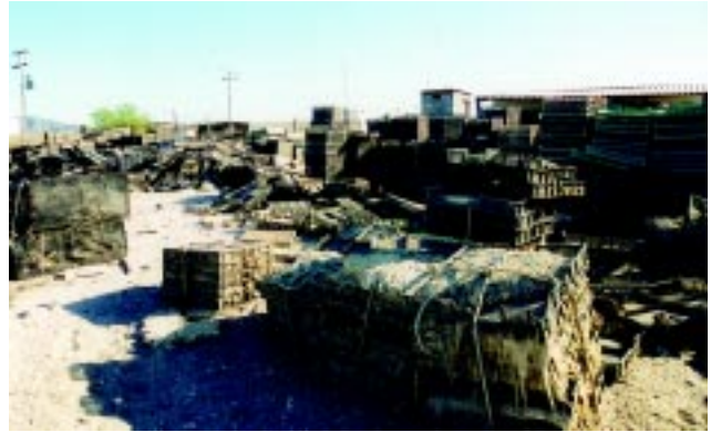
Figura 9 Es necesario contar con áreas delimitadas para desechos o material que no se utilice y alejadas del área de operaciones.

concentraciones adecuadas para evitar problemas sobre la inocuidad del producto. Si se requiere, se puede aplicar calor para destruir los microorganismos sobre la superficie.