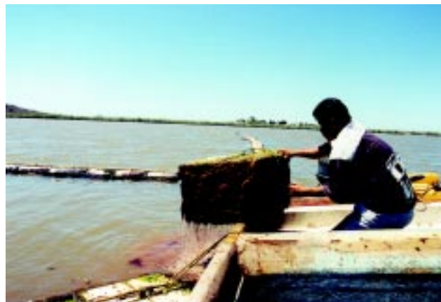
Figura 11 Traslado de moluscos a áreas de cultivo que cumplen con las especificaciones de buena calidad del agua.

Estas medidas se tomarán con base a la clasificación del sitio y por ende, del grado de contaminación y tipo de contaminante.