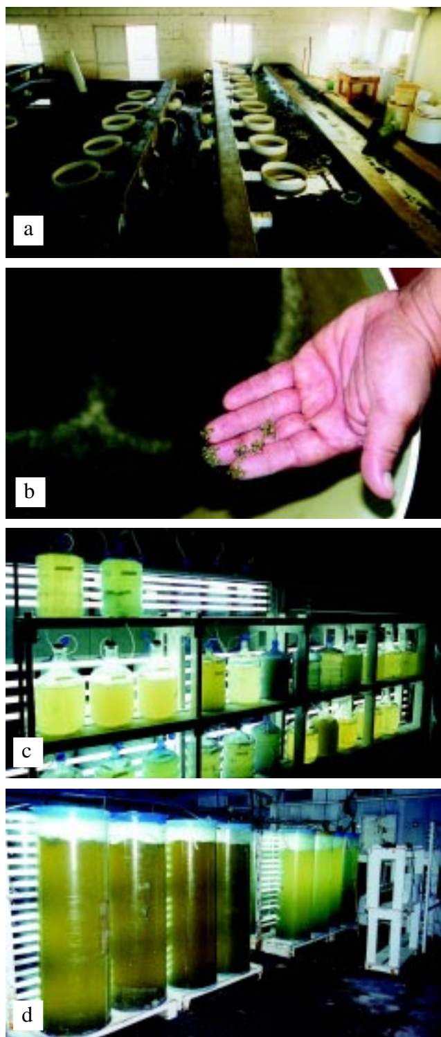
Figura 12 Sistema de producción de semillas de ostión del pacífico y cultivo de microalgas a diferentes volúmenes en el Laboratorio de Producción del Instituto de Acuicultura del Estado de Sonora. a) área de fijación de la larva, b) semillas, c) garrafones y d) columnas.

cloro a una concentración de 2 ppm, el cual posteriormente es neutralizado con tiosulfato de sodio. El cloro es efectivo para destruir a la mayoría de los microorganismos que son patógenos a algas y/o larvas. Los compuestos de cloro se pueden usar en la forma de cloro libre, hipoclorito de sodio, blanqueadores caseros a base de hidróxido de sodio, o hipoclorito de calcio.