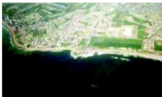
Figura 4 Presencia de marea roja en Mazatlán, Sin. (verano del 2000).

acumulados por los moluscos durante el proceso de filtración y provocar algún efecto nocivo al consumidor si los primeros no son sujetos a un proceso de depuración eficiente. Afortunadamente muchos de los plaguicidas con tiempos largos de residencia, han sido prohibidos por las autoridades y su uso ha disminuido considerablemente. Por otro lado, los metales pesados pueden ser acarreados por el agua de los ríos y entrar al primer eslabón de la cadena trófica (microalgas) para pasar posteriormente a los moluscos o bien ser absorbidos directamente de la columna de agua (Tabla 2).