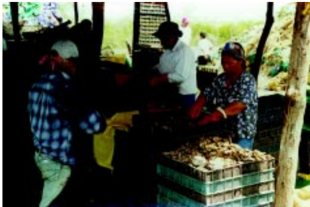
Figura 14 Considerar la higiene del personal, del equipo de recolección y de las instalaciones durante la cosecha.

■ El personal que participa en la cosecha, deberá cumplir con las observaciones de buenas prácticas de higiene descritas anteriormente. Se debe prohibir el uso de todo tipo de joyas, adornos, relojes, maquillaje, etc.; así como fumar, comer y escupir en las áreas de trabajo (Figura 14).